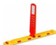
VERKEHRSTECHNIK traffic technology