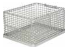
DRAHTKÖRBE wire basket