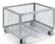
BETRIEBSEINRICHTUNG company equipment