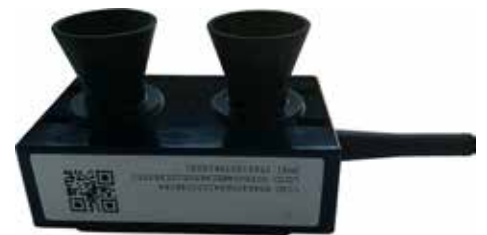
Füllstandsmessung für Behälter