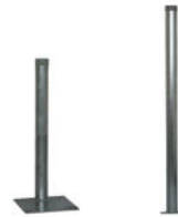
zum Aufdübeln / Einbetonieren